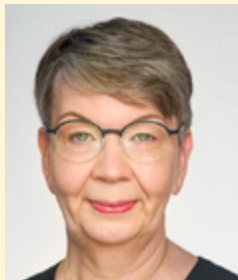
Landesbischöfin Kristina Kühnbaum-Schmidt Beauftragte des Rates der EKD für Schöpfungsverantwortung

Der Klimawandel bedroht das Leben der Schöpfung, deren Teil wir sind. Wir Menschen verursachen, was sich gegenwärtig vollzieht. Und wir in den reichen Ländern tragen dazu in weit überwiegendem Maße bei. Die Folgen des Klimawandels verstärken Armut, Hunger und Ungerechtigkeit weltweit. Der Krieg Russlands gegen die Ukraine hat die Welt in eine weitere große Krise gestürzt, die nicht nur dort Leid und Tod verursacht, sondern auch in anderen Teilen der Welt.